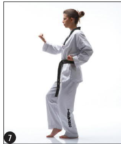
MONTONG BAKKAT MAKI OREN BEUM SEUGUI