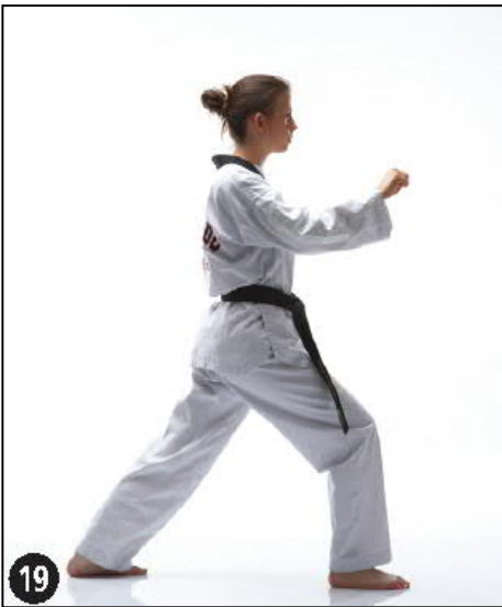
MONTONG BAKKAT PALMOK HETCHEU MAKI OREN AP KOUBI SEUGUI