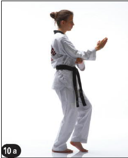
KEUDEURO BATANGSON MONTONG AN MAKI OWEN BEUM SEUGUI