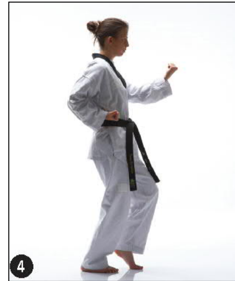
MONTONG BAKKAT MAKI OWEN BEUM SEUGUI