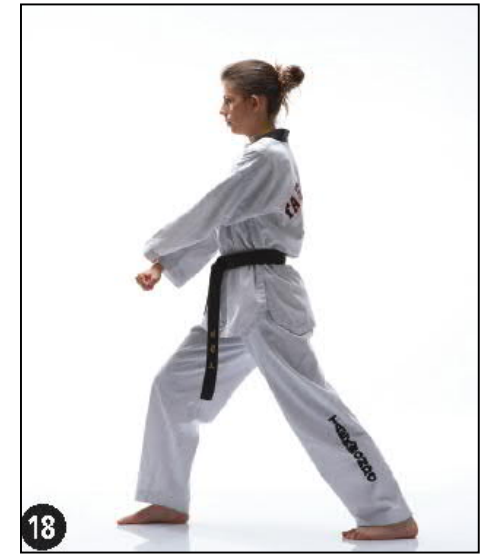
EUT KEURO ALE MAKI OREN AP KOUBI SEUGUI