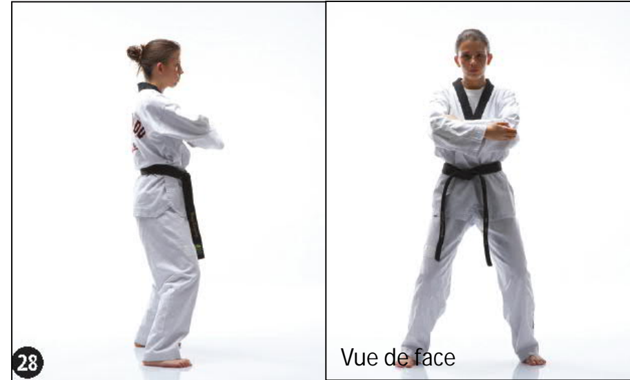
PALKOUP MONTONG PYO JEUK TCHIGUI JOUTCHOUM SEUGUI