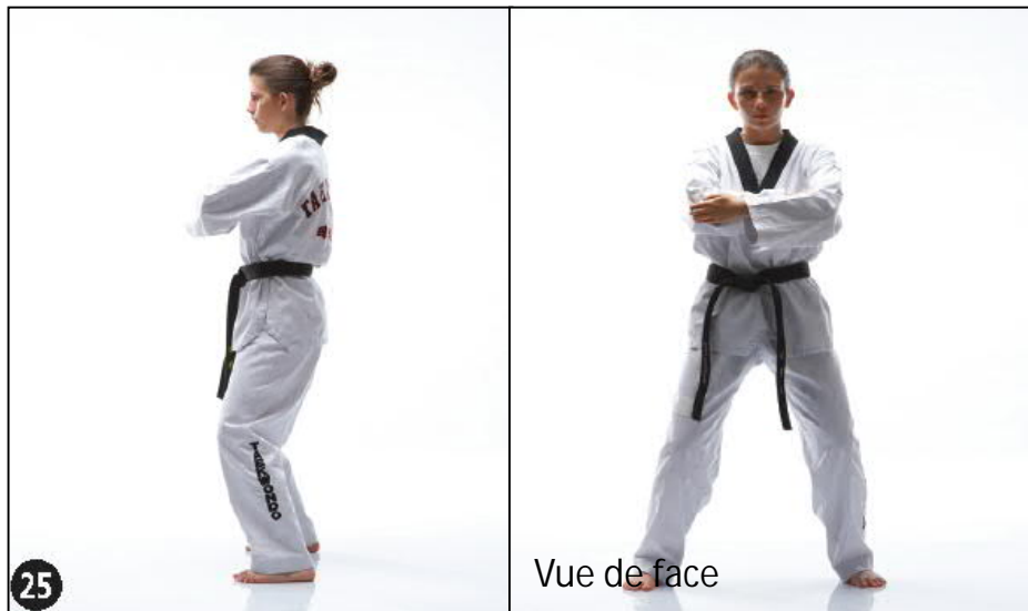
PALKOUP MONTONG PYO JEUK TCHIGUI JOUTCHOUM SEUGUI