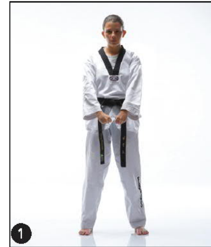
JOUMBI NARANHI SEUGUI

et les positions « Beum Seugui" et « Joutchoum Seugui"