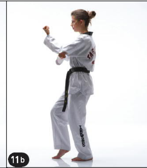
Sur Place KEUDEURO DEUNG JOUMOK EULGOUL AP TCHIGUI OREN BEUM SEUGUI