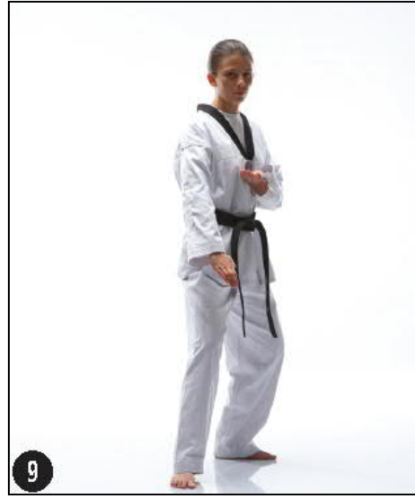
SONNAL ALE MAKI OWEN DWITT KOUBI

Ramener le pied droit derrière le gauche Jambe avant Gauche en appui En position OWEN BEUM SEUGUI