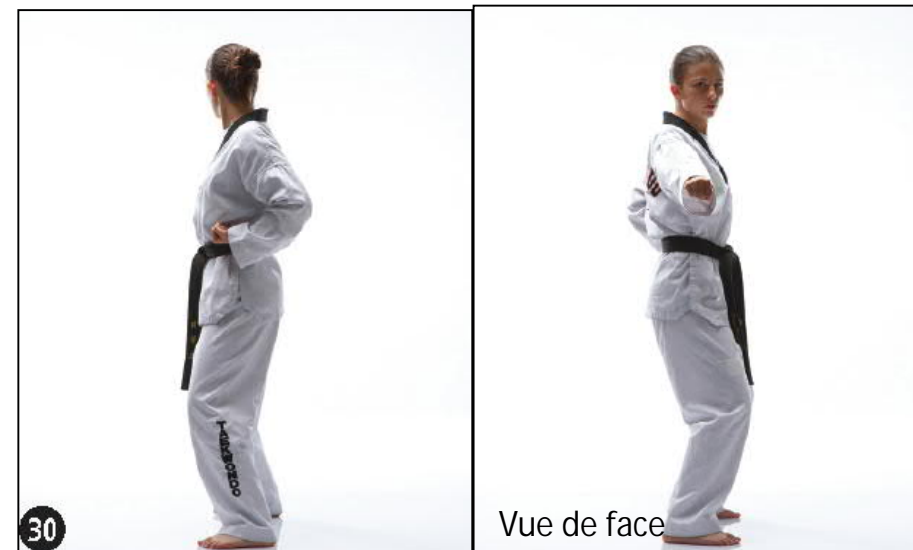
MONTONG YOP JILEUGUI - KIAP JOUTCHOUM SEUGUI