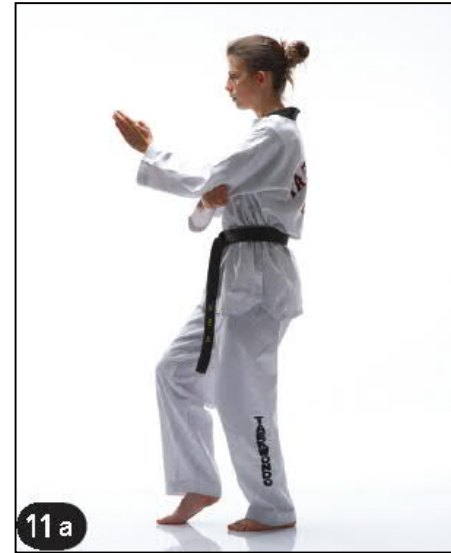
KEUDEURO BATANGSON MONTONG AN MAKI OREN BEUM SEUGUI