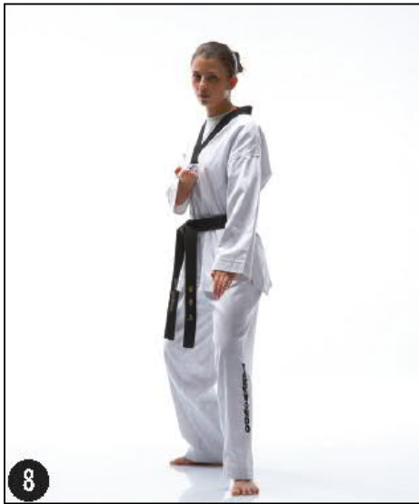
SONNAL ALE MAKI OREN DWITT KOUBI