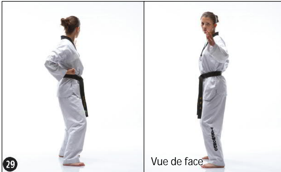
HAN SONNAL MONTONG YOP MAKI JOUTCHOUM SEUGUI