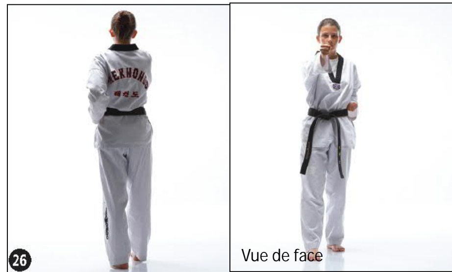
DEUNG JOUMOK EULGOUL BAKKAT TCHIGUI OREN AP SEUGUI