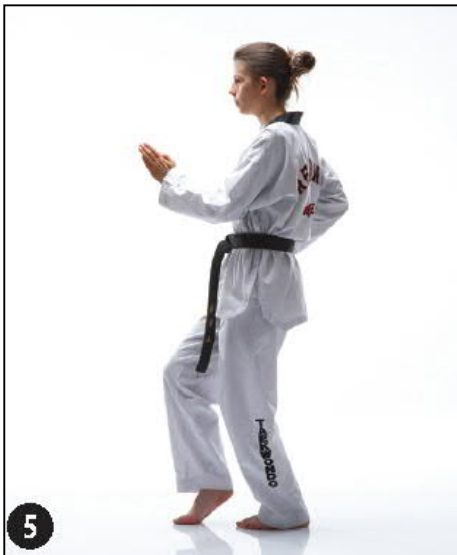
BATANGSON MONTONG AN MAKI OREN BEUM SEUGUI