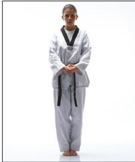
Debut du mouvement 8 s MOA SEUGUI