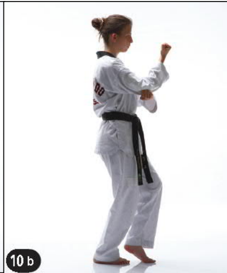
Sur Place KEUDEURO DEUNG JOUMOK EULGOUL AP TCHIGUI OWEN BEUM SEUGUI