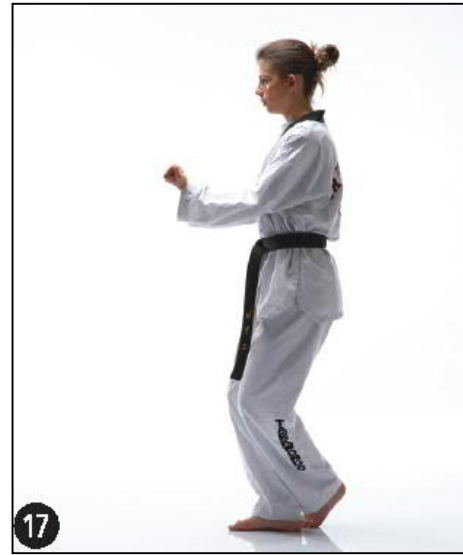
DOU JOUMOK JETCHO JILEUGUI OREN DWITT KOA SEUGUI