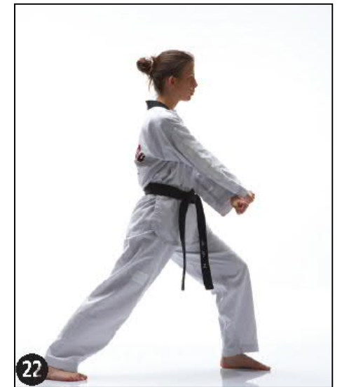
EUT KEURO ALE MAKI OWEN AP KOUBI SEUGUI