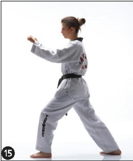
MONTONG BAKKAT PALMOK HETCHEU MAKI OWEN AP KOUBI SEUGUI