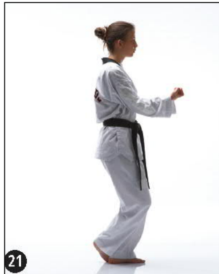
DOU JOUMOK JETCHO JILEUGUI OWEN DWITT KOA SEUGUI