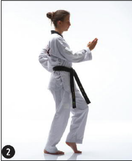
BATANGSON MONTONG AN MAKI OWEN BEUM SEUGUI