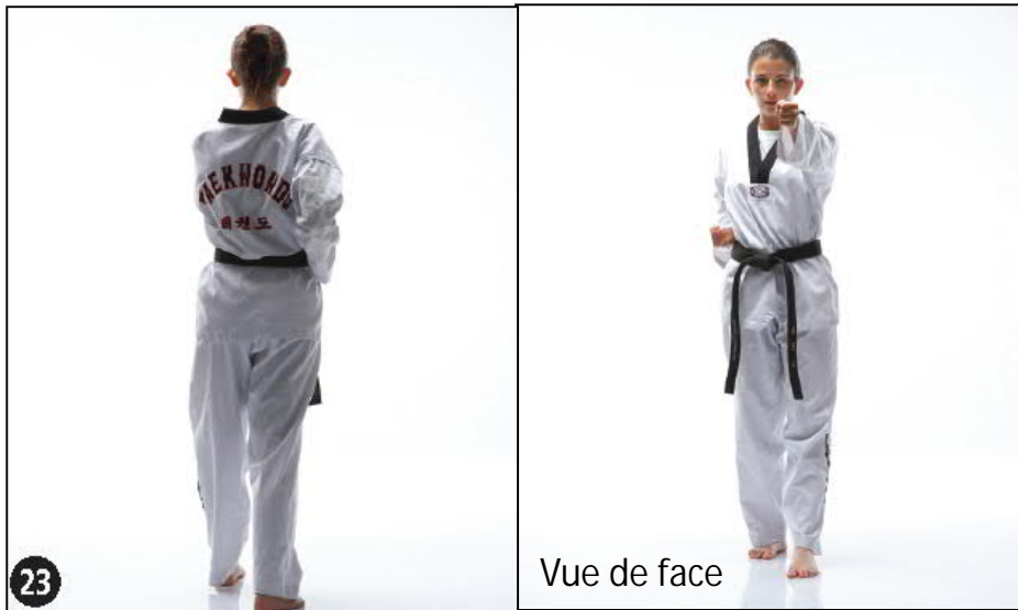
DEUNG JOUMOK EULGOUL BAKKAT TCHIGUI OWEN AP SEUGUI