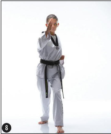
HAN SONNAL EULGOUL PITREU MAKI OWEN AP KOUBI SEUGUI