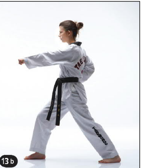
MONTONG BARO JILEUGUI OREN AP KOUBI SEUGUI