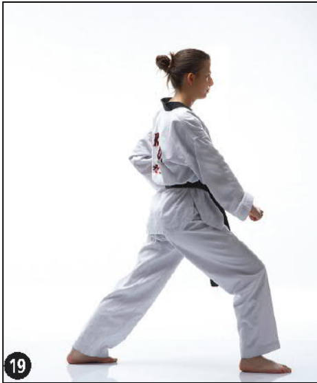
ALE MAKI OREN AP KOUBI SEUGUI