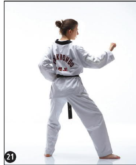
MONTONG BAKKAT MAKI OREN DWITT KOUBI SEUGUI