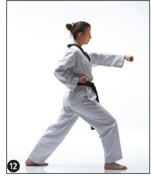
MONTONG BARO JILEUGUI OREN AP KOUBI SEUGUI