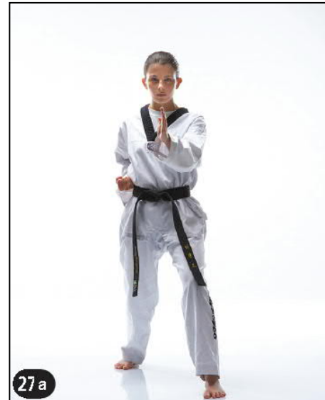
BATANGSON MONTONG MAKI OWEN AP KOUBI SEUGUI