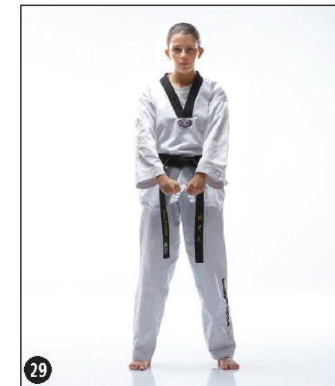
JOUMBI NARANHI SEUGUI