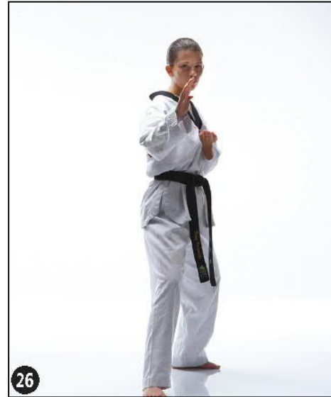
SONNAL MONTONG MAKI OREN DWITT AP SEUGUI