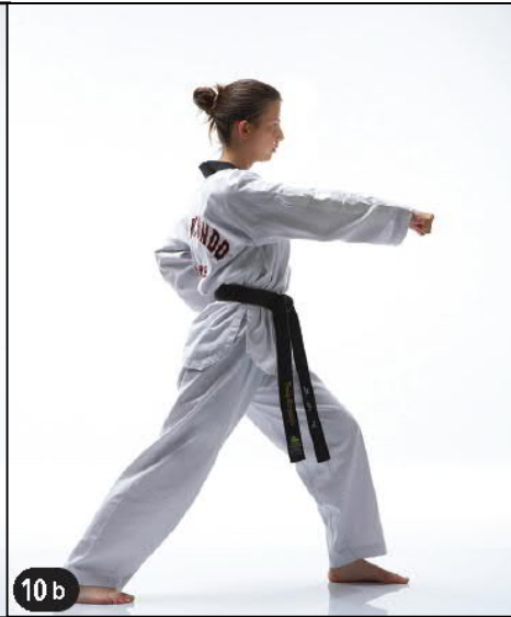
MONTONG BARO JILEUGUI OWEN AP KOUBI SEUGUI