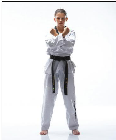
Ramène le pied gauche Armement du mouvement