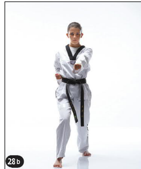
MONTONG BARO JILEUGUI OREN AP KOUBI SEUGUI