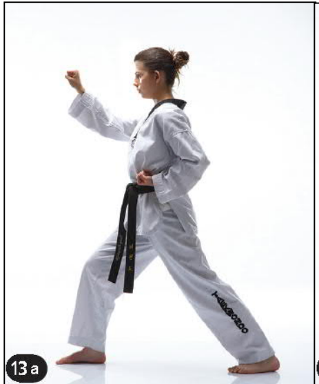
EULGOUL BAKKAT MAKI OREN AP KOUBI SEUGUI