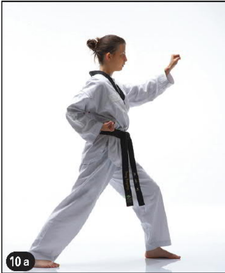
EULGOUL BAKKAT MAKI OWEN AP KOUBI SEUGUI