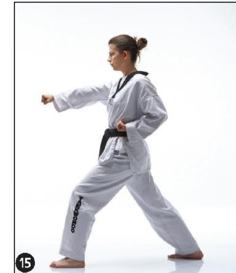
MONTONG BARO JILEUGUI OWEN AP KOUBI SEUGUI 4