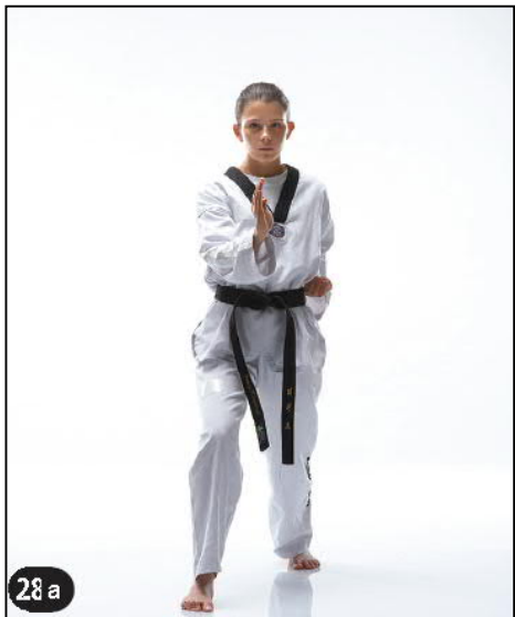
BATANGSON MONTONG MAKI OREN AP KOUBI SEUGUI