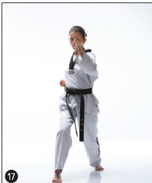
17 HAN SONNAL EULGOUL PITREU MAKI OREN AP KOUBI SEUGUI