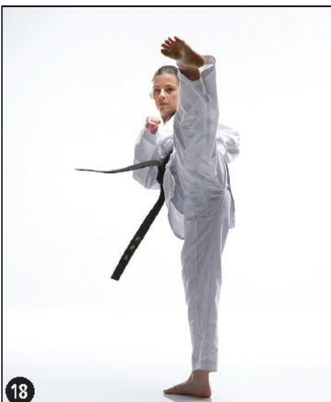
18 DOLYEU TCHAGUI KIAP JANG

Poser le pied Gauche devant puis Pied gauche en rotation dos en Ap Koubi Seugui ALE MAKI