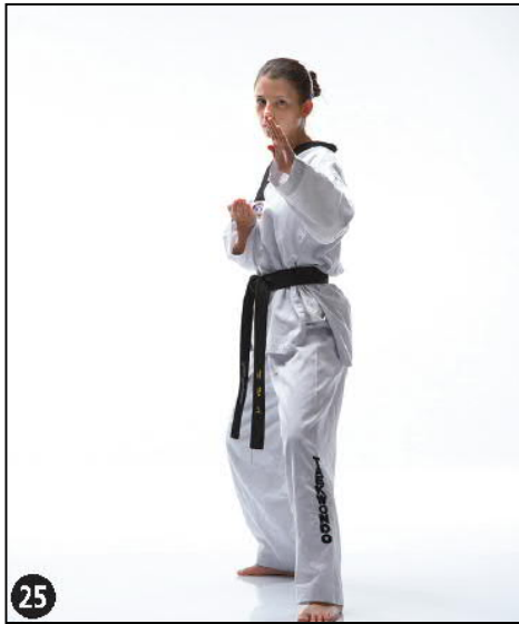
SONNAL MONTONG MAKI OWEN DWITT AP SEUGUI